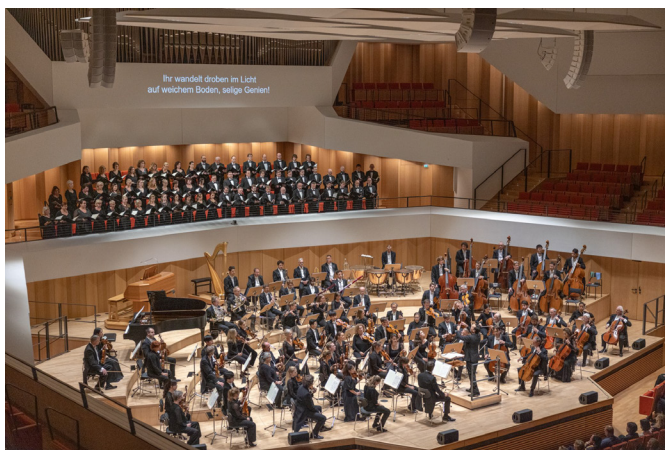
Eröffnung der 25. TDKT im Kulturpalast Dresden

Anlässlich des halbrunden Jubiläums wurde die Eröffnung diesmal etwas größer gefeiert. Sie fand im Kulturpalast Dresden statt und wurde in Kooperation mit der Dresdner Philharmonie durchgeführt, die über 600 Gästen ein eindrucksvolles Konzert mit dem Prager Philharmonischen Chor boten.