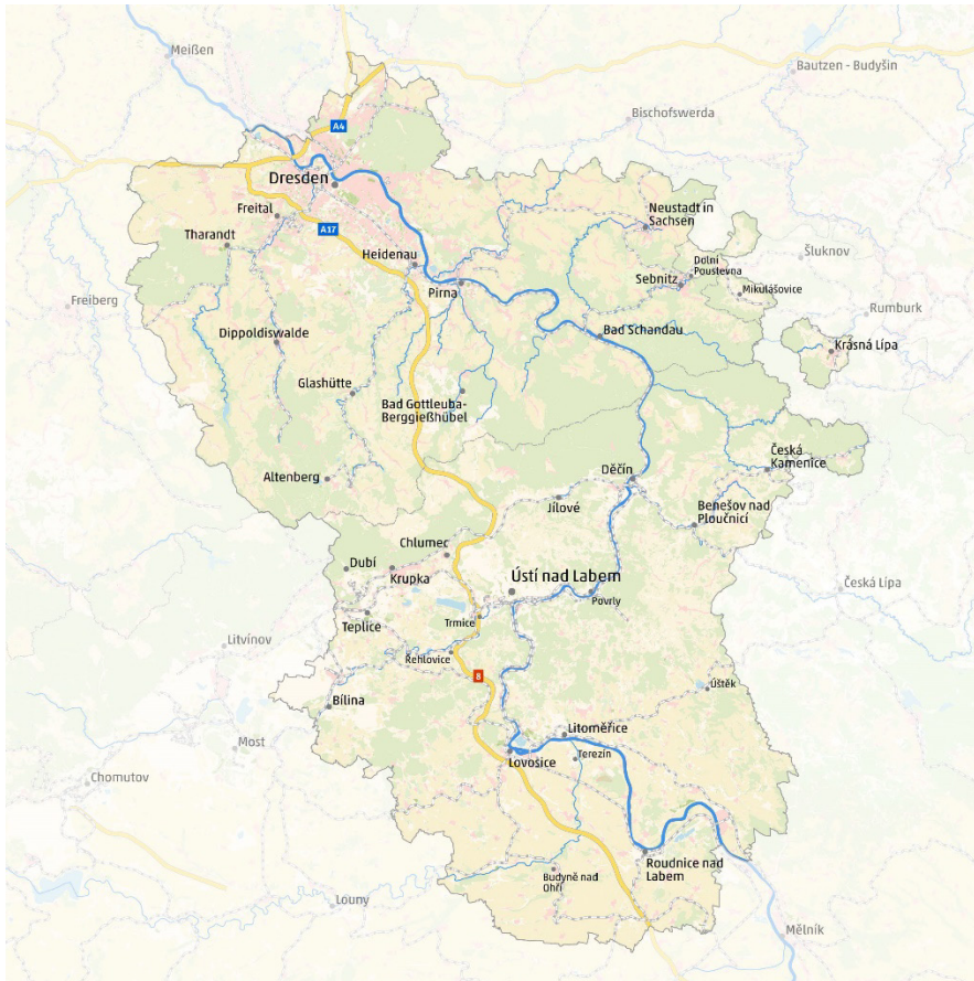
Gebiet der Euroregion Elbe/Labe