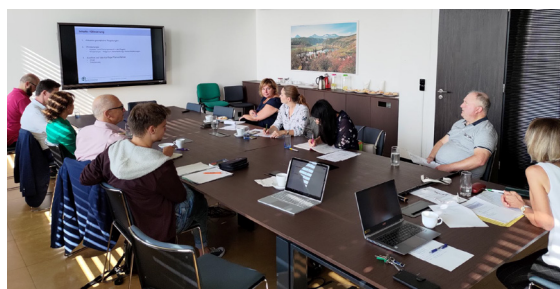
Fachgruppe Raumentwicklung am 19.09.2023 in Ústí

In der Beratung der Fachgruppe Raumentwicklung am 19.09.2023 in Ústí nad Labem ging es viel um Windenergie in Sachsen und Tschechien. Der Regionale Planungsverband OE/OE berichtete über die veränderte Rechtslage in Deutschland und deren Folgen, während vom Bezirk Ústí die recht überschaubare Nutzung von Windenergie aufgezeigt wurde. Zudem wurde die Entwicklungsstrategie der Bezirks Ústí für den sächsisch-tschechischen Grenzraum vorgestellt.