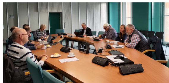
Arbeitsausschuss am 12.10.2023 in Dresden

In der Herbstsitzung des Arbeitsausschusses standen der (inzwischen fertige) Jahresabschluss 2022 sowie die Haushaltsplanung 2024 auf der Tagesordnung. Doch zuvor berichtete der Geschäftsführer ausführlich über die Arbeit der Euroregion. Mit den Aktivitäten auf Bundesebene (siehe Einleitung), den bevorstehenden Tschechisch-Deutschen Kulturtagen, diversen Projektaktivitäten sowie einer Neueinstellung gab es einiges zu erläutern.