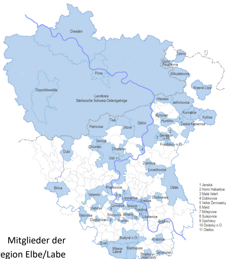
Mitglieder der Euroregion Elbe/Labe