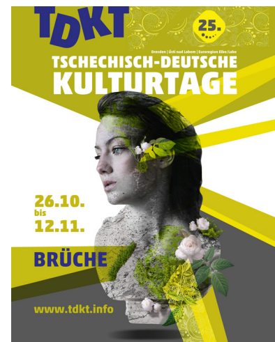
Plakatomotiv der 25. Tschechisch-Deutschen Kulturtage

Auf tschechischer Seite war es nach den schlechten Erfahrungen der Vorjahre gelungen, mit dem Veřejný sál Hraničář einen neuen Partner zur Koordination und Organisation von Veranstaltungen zu finden. Auch wenn dieser Partner sehr spät in die Planung des Festivals einstieg, konnte er dennoch aus dem Stand 12 Veranstaltungen