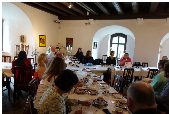
Fachgruppe Kultur/Tourismus/Naherholung am 14.09.2023 auf Schloss Kuckuckstein

Die zweite Sitzung der Fachgruppe fand am 14.09.2023 auf Schloss Kuckuckstein statt. Es wurde eingangs über verschiedene kulturelle Projekte berichtet, die z.T. von der Euroregion Elbe/Labe unterstützt werden, so eines zur bildlichen Darstellung von Synagogen auf tschechischer Seite sowie eine Wanderausstellung zur sog. Fürstenauer Madonna. Außerdem wurden die Vernetzungsaktivitäten verschiedener Akteure aus der Region vorgestellt, in die u.a. auch Schloss Kuckuckstein eingebunden ist.